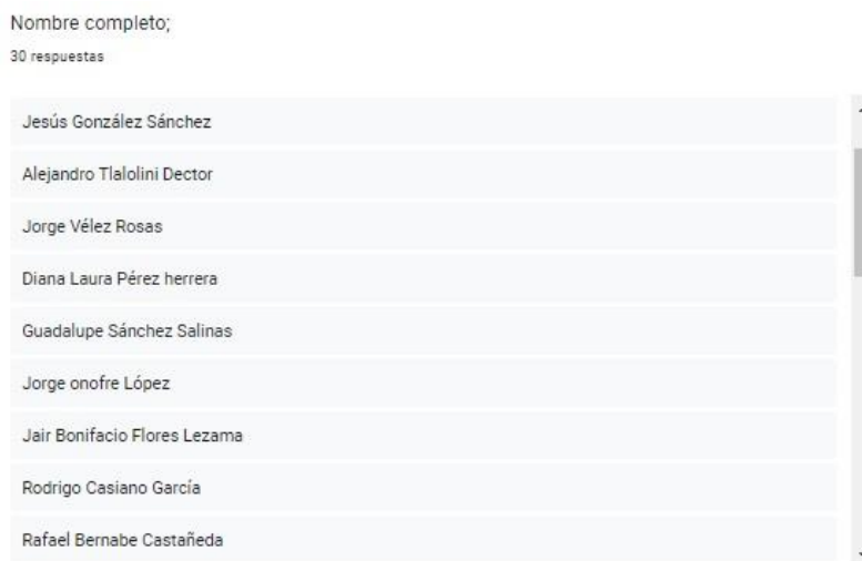
Figura 3. Ejemplo de egresados encuestados.

De los 50 cuestionarios enviados se obtuvieron 30 respuestas. Debido a que el porcentaje es mayor al 50%, se considera aceptable el muestreo.