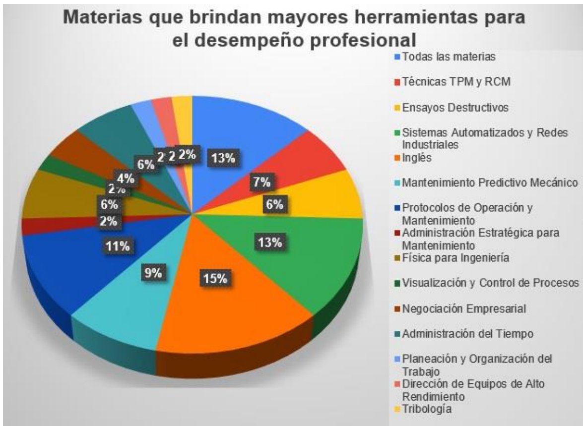
Figura 8. Resultado de la encuesta con las materias que brindan mayores herramientas