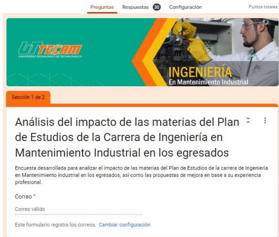
Figura 1. Encuesta para egresados.